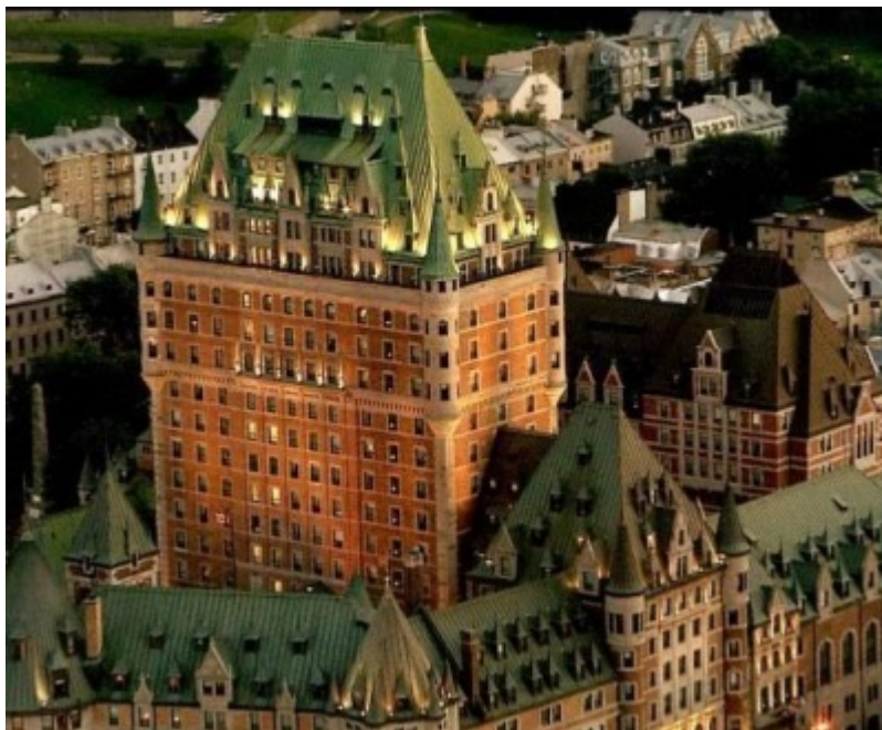
Photo : Québec, l'Hôtel-Château Frontenac, de style médiéval.

Le Québec est le dernier témoin de la Nouvelle France, cet immense territoire d'Amérique du Nord allant jadis de l'embouchure du fleuve Saint-Laurent au delta du fleuve Mississipi en passant par la vallée de l'Ohio.