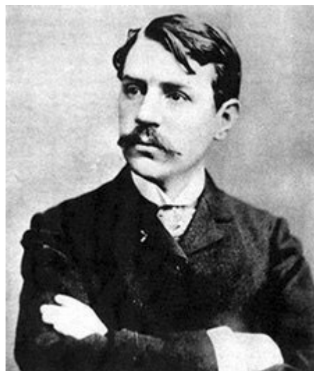
Photo : Paul Bourget, écrivain français, (1832-1935).

3 - JOURNAL QUÉBEC PRESSE : Il semble qu'une majorité d'Académiciens (les 40 immortels) souhaitent l'indépendance du Québec. Qu'en pensez-vous ?