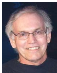
Michel CLOUTIER Journal Québec Presse VERSAILLES — Le samedi 7 août 2010

Donner un coup d'arrêt à la nouvelle politique internationale de « confrontation » de l'art classique et de l'art « contemporain » — Coordination Défense de Versailles