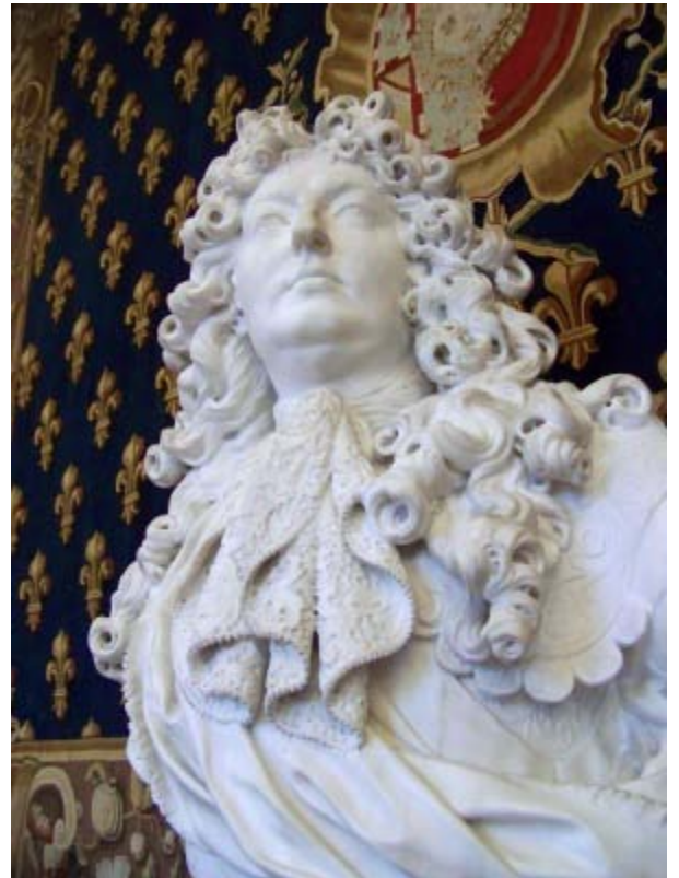
Photo: Superbe buste de Louis XIV

Pour en saisir toute la portée, voici l'exposé que l'on retrouve en page d'accueil de la coordination : http://coordination-defense-de-versailles.info/index.html