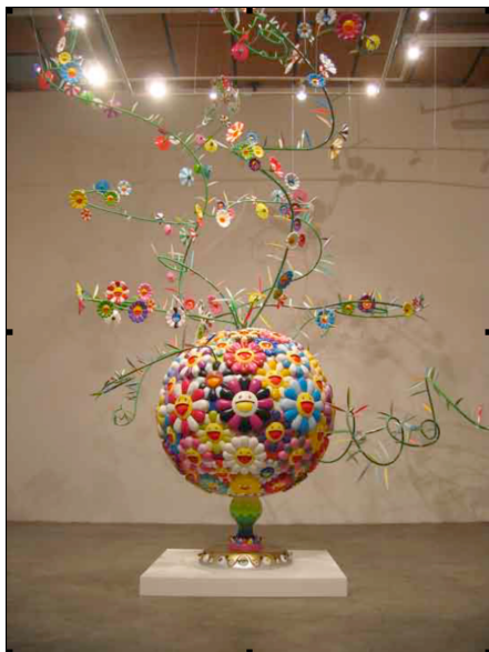
«Flower Matango (d)» 2001-2006 Peinture à l'huile, acrylique, fibre de verre et fer 315 x 204,7 x 263 cm

Chaque année, de septembre à décembre, les espaces du Domaine de Versailles s'ouvrent à l'art contemporain. Une occasion de faire dialoguer les grands artistes de l'époque baroque Jules Arduin Mansart, André Lenôtre, Charles Lebrun, Jacques Ange Gabriel avec des artistes contemporains: Jeff Koons, Xavier Veilhan...Des rencontres parfois contrastées, parfois fusionnelles, qui inscrivent Versailles comme un lieu vivant toujours ouvert à la création.