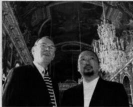
Jean-Jacques Aillagon, en compagnie de Takashi Murakami dans la Galerie des Glaces.

«Pour moi, cela a été un choc d'être invité au château de Versailles, explique l'artiste. Au Japon, lorsque nous construisons des châteaux, c'est pour protéger le pays, faire la guerre. Ici, le château abrite l'art et la culture.» L'artiste a également paru étonné par la collaboration d'œuvres contemporaines avec un château du XVII e siècle.